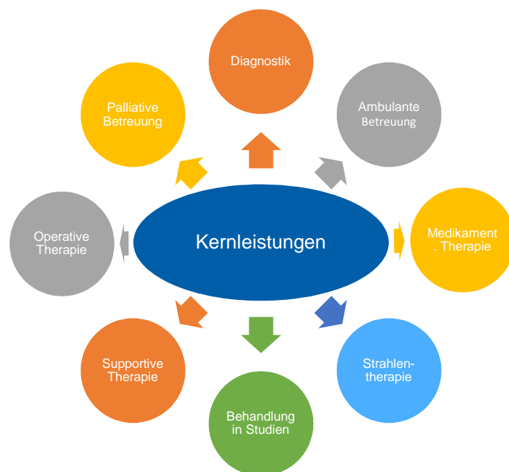
Abbildung 2: Kernleistungen des Tumorzentrums im Klinikum Hanau

Für Patienten mit onkologischen Erkrankungen bietet das onkologische Zentrum am Klinikum Hanau ein qualifiziertes Versorgungsangebot. Grundlage für diese Versorgung ist die interdisziplinäre Versorgungsstruktur. Dies bedeutet, dass die gesamte Versorgung der Patientinnen und Patienten von Abklärung, Diagnostik, Therapie, Nachsorge und palliative Versorgung durch das onkologische Zentrum organisiert wird.