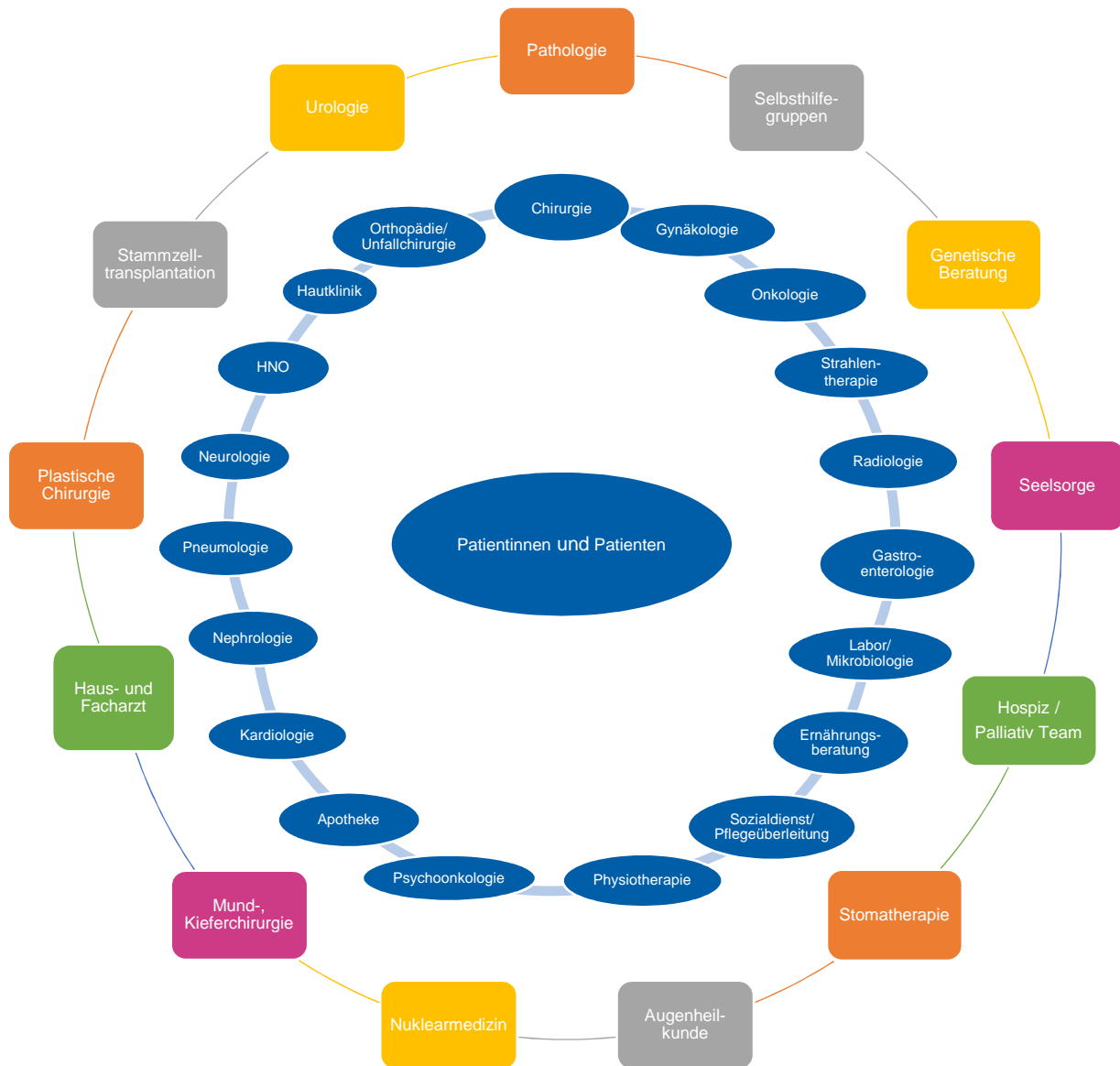
Abbildung 3: Interne und externe Kooperationspartner

Alle Kooperationspartner des Tumorzentrums Klinikum Hanau sind im Stammbblatt gelistet und über OnkoMap bei OnkoZert veröffentlicht: https://oncomap.de